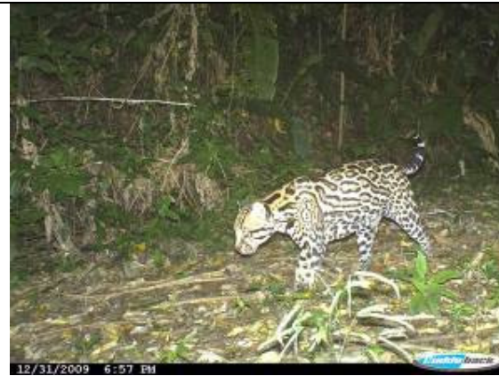
Ocelote ("letrina MR") ( Leopardus pardalis )