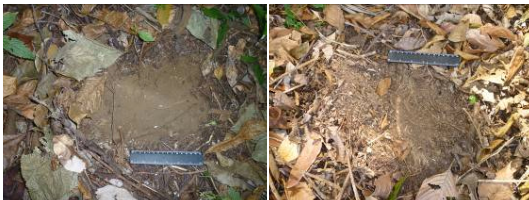
Rasgados de puma en los carriles de Cerro Arbolito (Enero de 2010).

En la gira participaron dos personas de la revista de los carros Jaguar, lo cual fue muy productivo y provecho contarles como se instalan las cámaras trampa y por que las ubicamos en los senderos la mayoría de las veces. Además, ellos tuvieron la oportunidad de ver las hermosas vistas de la propiedad, rasgados y excretas de pumas.