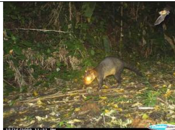
Mapache cangrejero ( Procyon cancrivorus )