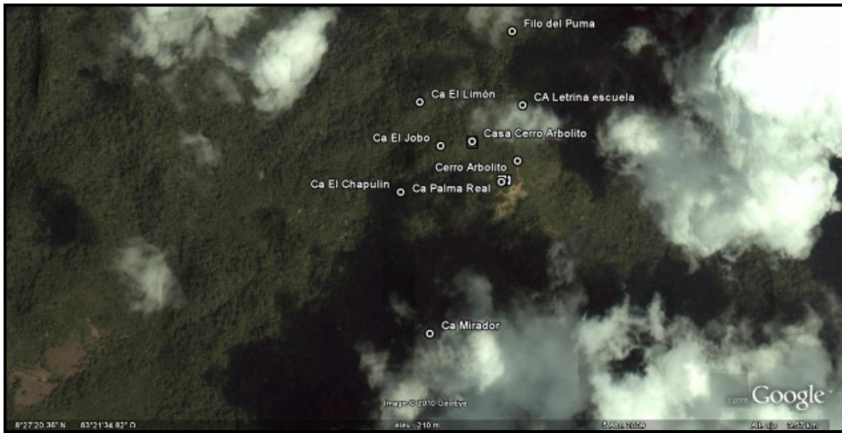
Imagen 2. Vista de las estaciones en el campo utilizando Google Earth versión 7.0