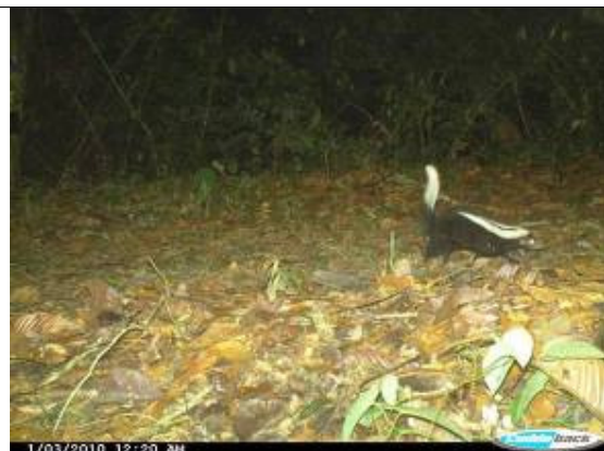
Zorro hediondo ( Conepatus semistriatus )