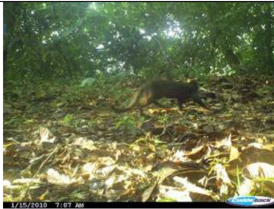
Yaguarundi ( Herpailurus yaguarondi )