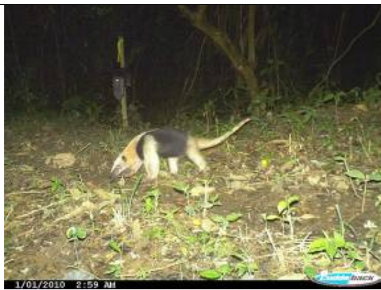
Hormiguero ( Tamandua mexicana )