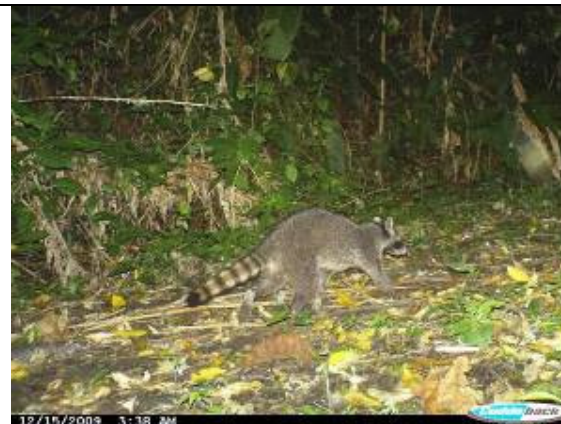
Mapache ( Procyon lotor )