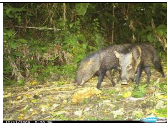
Sáinos ( Pecari tajacu )