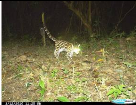
Margay ( Leopardus wiedii )