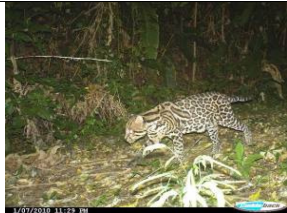
Ocelote ("el viejito") ( Leopardus pardalis )