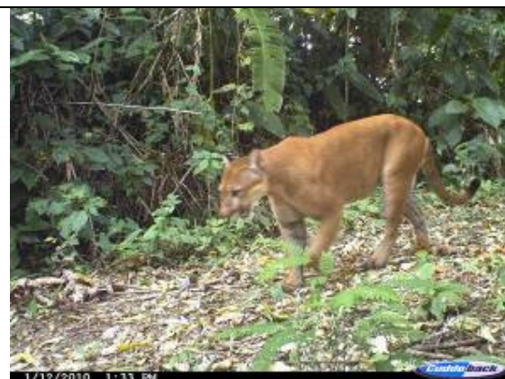
Puma ( Puma concolor )