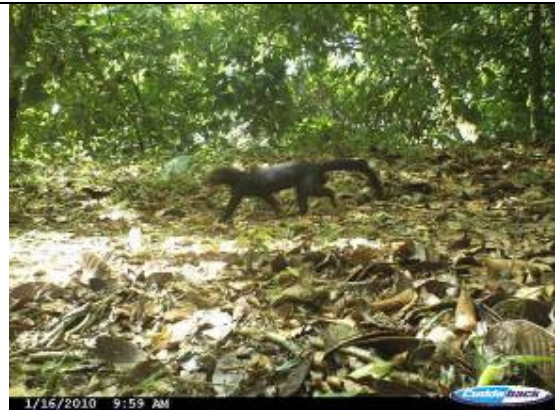
Tolomuco ( Eira barbara )