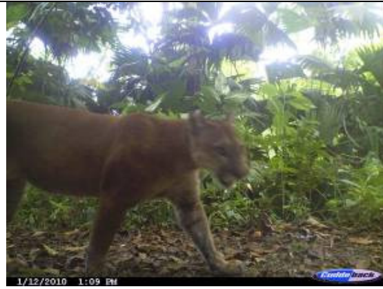
Puma ( Puma concolor )